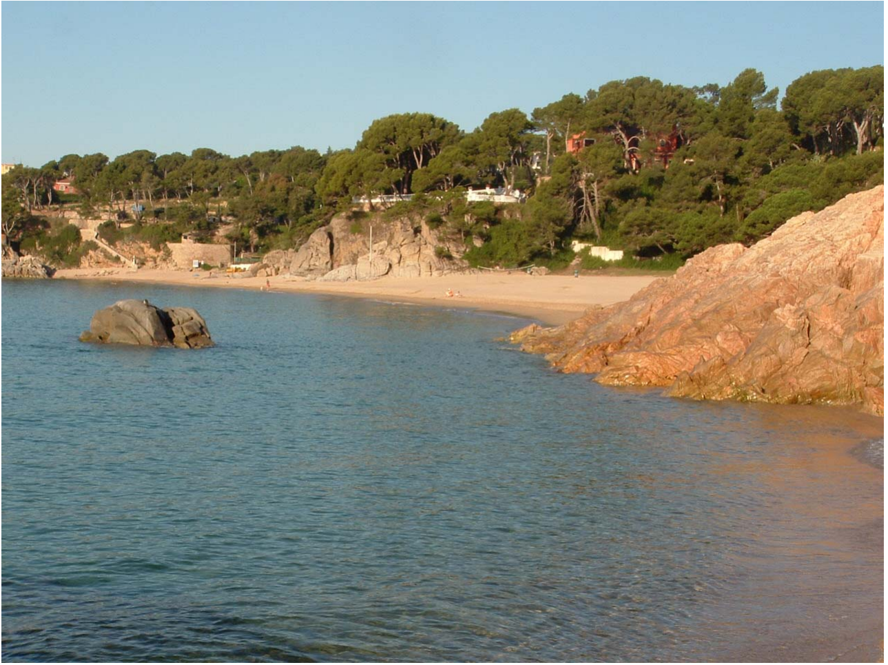
SPIAGGIA CAMPING TREUMAL