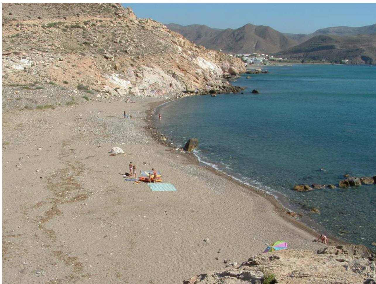
SPIAGGIA DEL CAMPEGGIO